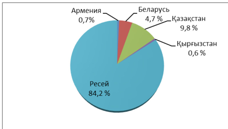
3-сурет – ЕАЭО мүше-мемлекеттерінің 2017 жылғы қаңтар-шілде айларындағы сыртқы саудадағы үлестері (%)

ЕАЭО мүше-мемлекеттерінің 2017 жылғы қаңтар-шілде айларындағы сыртқы саудадағы үлестерін төмендегі диаграммадан көруімізге болады.