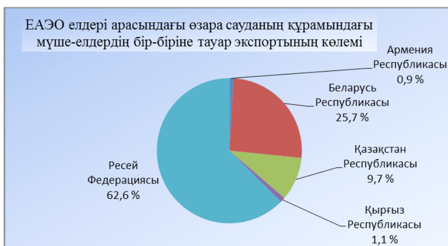
1-сурет – 2017 жылдың қаңтар-шілде айларындағы ЕАЭО елдері арасындағы өзара сауданың құрамындағы мүше-елдердің бір-біріне тауар экспортының көлемі

Енді осы соманың құрылымына келсек, оның құрамындағы экспорт пен импорт көлемін төмендегі № 1 және № 2 диаграммалардан көруімізге болады.