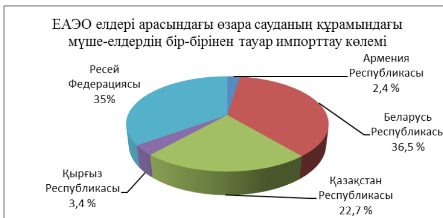
2-сурет – 2017 жылдың қаңтар-шілде айларындағы ЕАЭО елдері арасындағы өзара сауданың құрамындағы мүше-елдердің бір-бірінен тауар импорттау көлемі