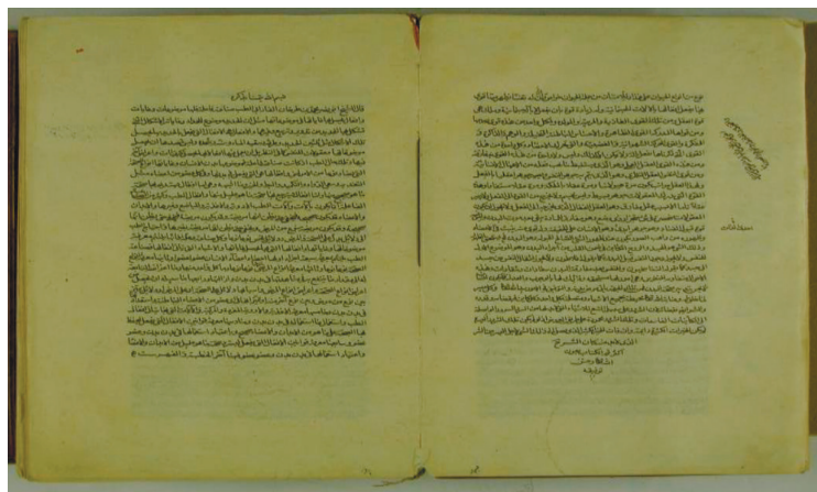
1-сурет – Әбу Насыр әл-Фарабидің Risala fi-Tibb (رسالة في الطب) трактатының қолжазбасы (Топкапы мұрағаты)

Осылардың ішінен ойшылдың Risala fi-tibb (Медицина жайлы трактат) еңбегі отандық фарабитану ғылымында арнайы зерттеу нысанына алынбаған, ғылыми айналымға түспеген тың еңбек. Трактат мәтінін алғаш рет түрік ғалымы Фуат Сезгин (Fuat Sezgin) 1960 жылы « Üç macnuat ar-rasail » (Үш трактаттар жинағы) атты мақаласында жариялады (Сезгин, 1960:3).