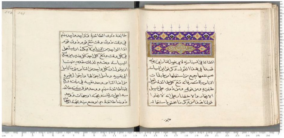
2-сурет – Топкапы мұрағатындағы Әбу Насыр әл-Фараби еңбегінің бірінші парағы (241 п/А/Б)

Аталған жинақтың парақтары сарғыш келген көне, сыртқы тысы сұры қағазбен тысталған. Қолжазбаның бірінші парағында үш мөрлі таңба басылған. Жинақ наسخ жазу түрімен, ірі-ірі әріптермен айқын жазылған. Кей әріптер ноқатсыз берілген. Көшірілген уақыты хижри 884 екені көрсетілген.