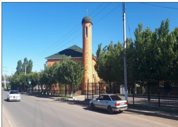
Рисунок 8 – Мечеть «Шейх Кунта-Хаджи»

В столице также функционирует мечеть, которая является центром религиозной и культурной жизни отдельной диаспоры, а также примером симбиоза официальной религиозной власти и этноконфессионального сообщества. Мечеть «Шейх Кунта-Хаджи» построена в 2009 году на пожертвования представителей вайнахской диаспоры. Она расположена практически на окраине правобережья столицы рядом с городским кладбищем, ее незаметное местоположение позволяет священнослужителям и религиозному сообществу находиться вдали от множества официальных государственно-конфессиональных событий, часто проводимых в столице. Здание мечети из красного кирпича внешне напоминает один из многочисленных коттеджей города, лишь название над входом в мечеть и небольшой минарет с полумесяцем позволяет идентифицировать его как исламское культовое сооружение (Рис. 8).