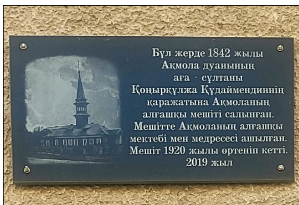
Рисунок 1 – Памятная доска на месте первой мечети города (улица Иманова, дом 2)

Акмолинска была закрыта, а в ее здании открыли историко-краеведческий музей. Здание «Красной» мечети просуществовало еще 40 лет, перед этим, как и многие мечети советского времени, прослужив для нужд культурной или хозяйственной жизни: в 1940 году, переместив историко-краеведческий музей в другое место, здание передали заводу «Казпиво»; в 1970 году, после сноса здания мечети, на его месте построили многоквартирный дом (Краевед..., 2021). В 2019 году на фасаде этого дома по улице Иманова (бывшая Мечетная) установлена памятная доска (Рис. 1)