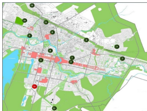
Рисунок 3 – Размещение ДУМК и мечетей в Астане

Чубары мечеть «Аль-Гани» (под номером 8), а также мечеть «Альжан ана» (11), которая находится на периферии города и свое расположение на левобережье отчасти «легитимизировала», получив имя матери первого Президента Казахстана (В столице..., 2014).