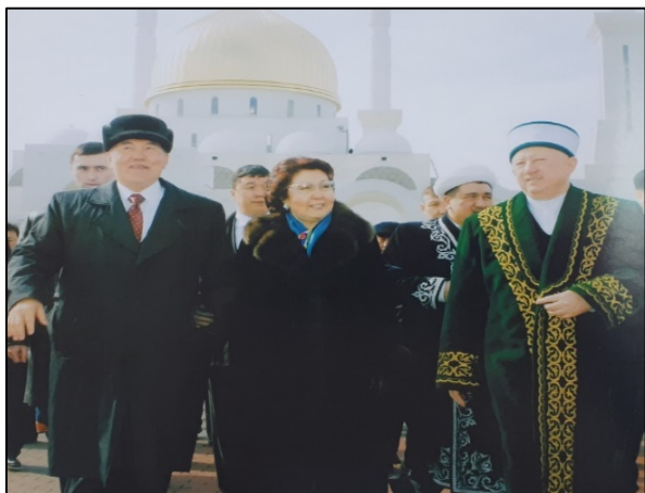
Рисунок 6 – На открытии мечети «Нур-Астана»

Открытие новой мечети «Нур-Астана» в 2005 году стало знаменательным событием для того времени, именно с нее начался процесс использования соборных мечетей в визуальной манифестации столицы, активного включения мусульманской идентичности в идеологические дискурсы власти (Рис. 6).