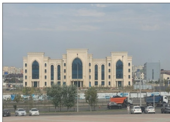
Рисунок 11 – Здание ДУМК в городе Астана

Факт позднего переезда центрального офиса ДУМК в Астану соответствует политике осторожного использования религиозных идеологием в первые десятилетия независимости и вписывается в рамки усилившейся позднее стратегии укрепления власти ДУМК над казахстанской уммой, активная фаза которой началась в 2011-2012 годах, после принятия нового Закона о религии и перерегистрации религиозных объединений страны. Переезд в новую столицу стал своеобразным символом окончательной