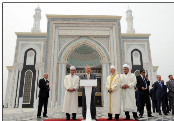
Рисунок 7 – Церемония открытия мечети «Хазрет Султан»

(Святейший Султан). Это один из эпитетов средневекового тюркского мыслителя, поэта и суфия Ходжа Ахмета Ясави, который похоронен на юге страны в городе Туркестан. Основатель тюркского суфийского тариката и автор труда «Диуани хикмет» сыграл ключевую роль в распространении ислама в Центральной Азии. По приказу полководца Тимура (Тамерлана) на его могиле был построен мавзолей, который стал центром традиционного паломничества мусульман Центральноазиатского региона.