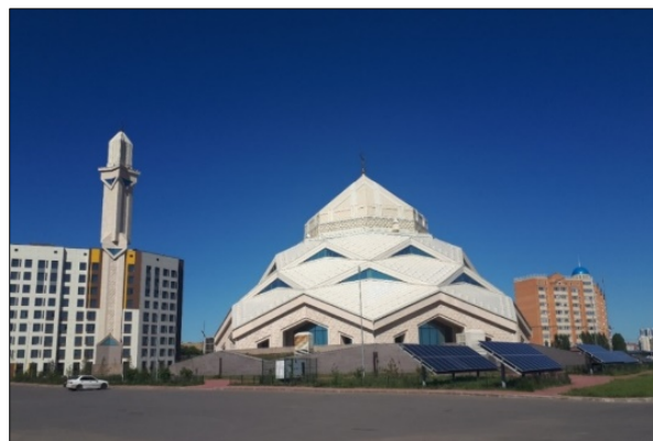
Рисунок 9 – Мечеть «Ырыскелди кажи»

Постмодернистская экомечеть «Цветок Аллаха». Мечеть «Ырыскелди кажи», прозванная в народе «Цветком Аллаха», построена в 2018 году (Рис. 9). Необычное культовое сооружение столицы, общая вместимость которого во время джума-намаза составляет около 2 тысячи человек (здание – 750 чел.), названо в честь отца Адильбека Джаксыбекова, занимавшего в тот период пост руководителя Администрации Президента и выступившего основным заказчиком и меценатом проекта.