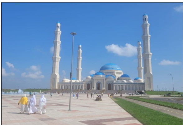
Рисунок 12 – Открытие новой центральной мечети ДУМК, 12 августа 2022 г.

В 2019 году Назарбаев заложил первый камень следующей соборной мечети столицы, официальное открытие которой прошло 12 августа 2022 года. Мечеть получила название Республиканской центральной мечети при ДУМК (Рис. 12).