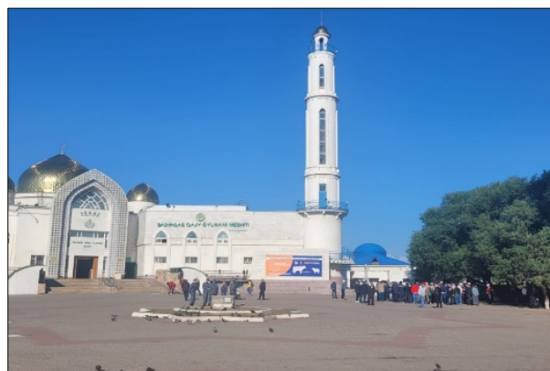
Рисунок 4 – Мечеть «Садуакаса кажы Гылмани» (день Курбан-айта, 2022 г.)

Во всех описанных случаях заметно активное участие государственных органов и предприятий в строительстве первых центральных мечетей в областных центрах, что в начальные годы независимости в целом было характерно для большинства регионов Казахстана. Особый интерес для нас представляет сообщение о Целиноградской областной мечети, которая должна была стать «самой большой в Северном Казахстане». Сейчас эта мечеть носит имя религиозного деятеля советского периода Садуакаса кажы Гылмани (Рис. 4).