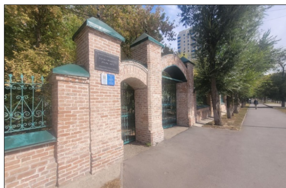
Рисунок 2 – Ограждение «Зеленой» мечети в Астане (проспект Абая, дом 41)

ворота, каменные опоры и железные решетки (Рис. 2). Сегодня ограждение мечети под номером 13 включено в список памятников истории и культуры местного значения города Астана (Постановление..., 2020). Это прекрасно иллюстрирует основной тезис инфраструктурного подхода, когда говорится о том, что о важности или наоборот ее отсутствии можно лучше судить после того как объект (в данном случае любой) теряет свое непосредственное функциональное предназначение и становится/или не становится объектом памяти. То, что от мечети остался только забор, в который происходят инвестиции по сохранению и включению его в реестры культурного наследия, говорит как раз о важности этого объекта прошлого для текущей ситуации.