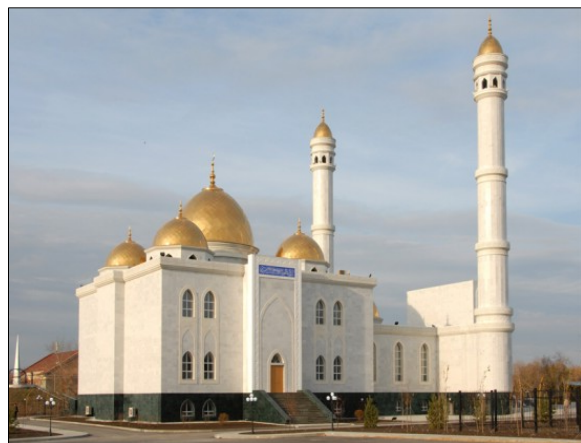
Рисунок 10 – Мечеть «Гашура ана» в селе Карабалык

ДУМК долгое время находилось в Алматы, несмотря на перенос столицы Казахстана в 1997 году. Решение о переезде в Астану приняли только в 2014 году (Муфтият, 2014) и лишь в 2018 году, за счет пожертвований меценатов в корпоративный фонд «Нұрлы Астана», недалеко от соборной мечети «Хазрет Султан» было построено новое здание казахстанского муфтията (Рис. 11).