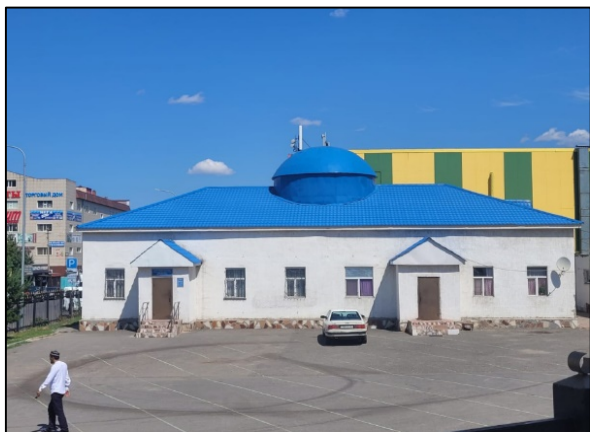
Рисунок 5 – Музей при мечети «Садуакас кажы Гылмани» (под музей отведена левая часть здания)

событие 1998 года описывается им как важный момент в истории мечетей города, так как с тех пор во время мусульманских праздников соборные мечети столицы стали местом посещения главы государства, а также зарубежных послов и политической элиты Казахстана (Занкоев, 2006: 39).