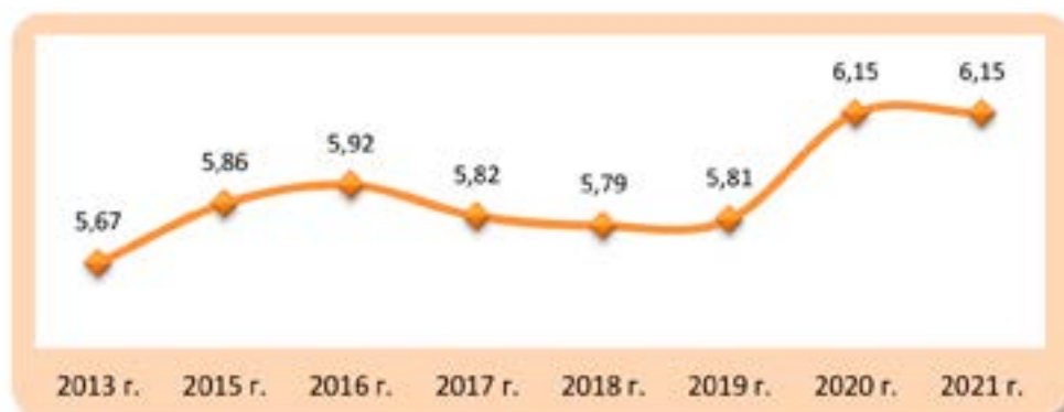
Рисунок 2 – Казахстан: Индекс счастья 2013 – 2021 гг. (Казахстан...); (100 самых...).

Тем самым лишний раз подтверждается сложность, многофакторность проблемы научного анализа и объективной оценки качества социальной сферы жизнедеятельности в единстве её субъективных и объективных параметров.