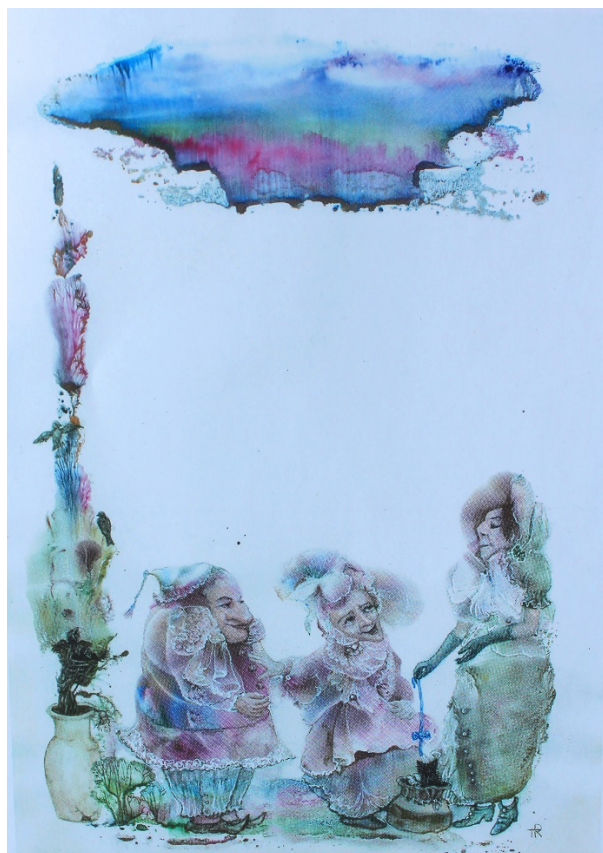
Рисунок 4 – Т. Репина. «Июль» к сказкам Максима Репина «Кикиморкин календарь», 2019

лабильности, нервных процессов, воображении (преобразование представления), пластике, гибкости, беглости мышления, памяти и интуиции» (Ильин, 2009: 175). Мы думаем, что этот способ особенно подходит для детей, у которых в самом процессе развивается творческое воображение, открывая новые возможности представления развития сюжета произведения. В качестве примера хотелось бы привести иллюстрацию «Июль» к сказкам Максима Репина «Кикиморкин календарь», 2019 Тамары Репиной (рис. 4).