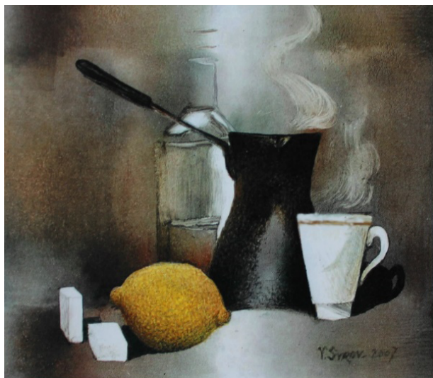
Рисунок 1 – В. Сыров. Кофе. 2006. Монотипия. Бумага, масляные краски

та в технике монотипии требует художественного темперамента, свойственного художнику, быстроты выполнения задуманной композиции, иначе есть вероятность высыхания масляной краски на металле.