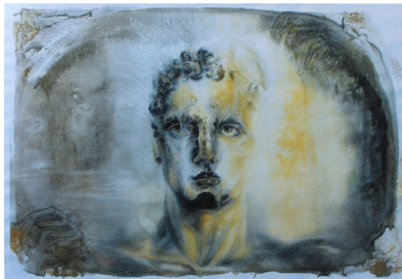
Рисунок 5 – А. Калшора. Олвин. 2018. Монотипия. Бумага, гуашь, цветные карандаши

Монотипия особенно хороша в иллюстрировании произведений фантастического жанра, именно через эту технику отображается загадочность, нереальность атмосферы сюжета. Работа в смешанных техниках монотипии дает возможность получить необычную фактуру, яркость и выразительность палитры, что своеобразно отражает характер фантастики. Одним из таких примеров послужил опыт Айжан Калшоры, автора этой статьи, которая представила на фестивале иллюстрации к фантастическому роману Артура Кларка «Город и звезды». Рассмотрим произведение, которое называется «Олвин», 2018 (рис. 5).